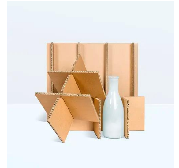
COMPLEMENTI DEL PACKAGING