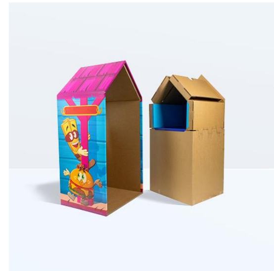
PROGETTI DI CARTOTECNICA