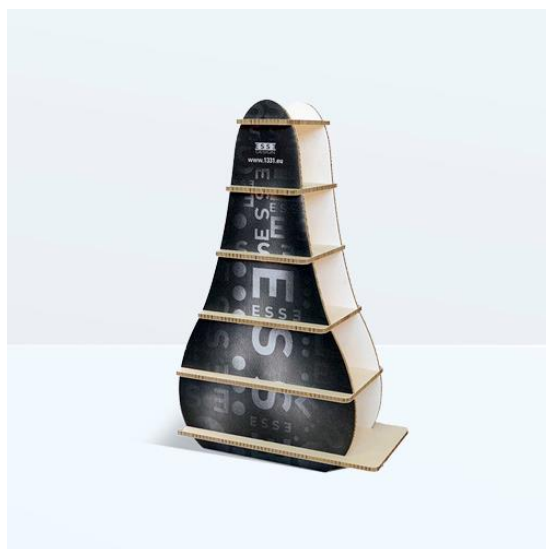
PROGETTI DI CARTOTECNICA