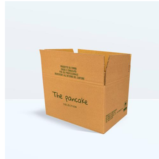
SCATOLE PER CONFEZIONATRICI AUTOMATICHE