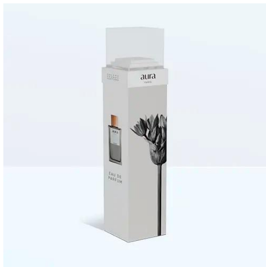
ESPOSITORI DA TERRA