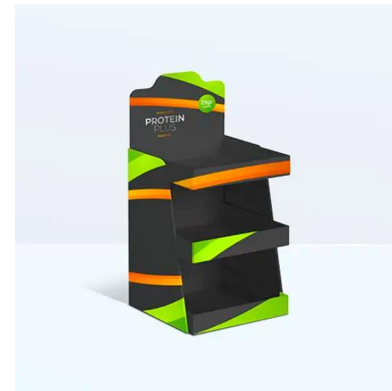
ESPOSITORI DA BANCO