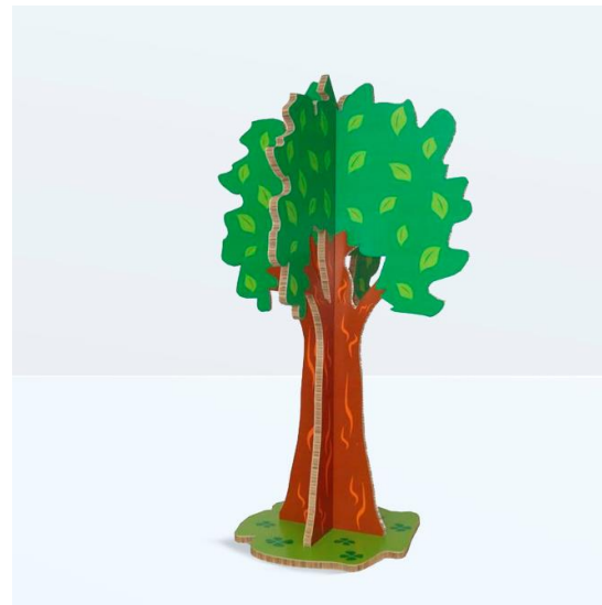
PROGETTI DI CARTOTECNICA