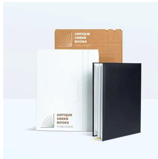
IMBALLAGGI PER LIBRI E PUBBLICAZIONI