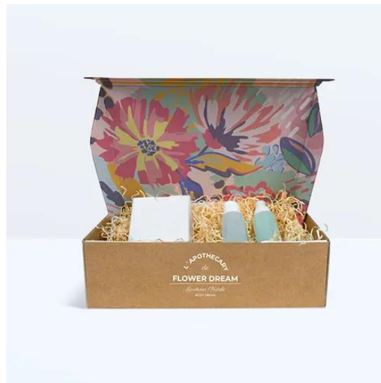
SCATOLE FUSTELLATE AUTOMONTANTI